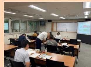
【図解で理解しやすい説明資料】【受講風景】