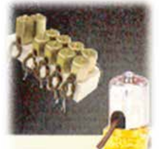
油圧制御用バルブ