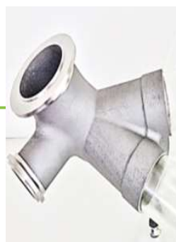
排気マニフォールド

自動車分野向け補用部品、金型の高性能化（最適流路）、治工具の軽量化、真球金属粉末の開発・製造等